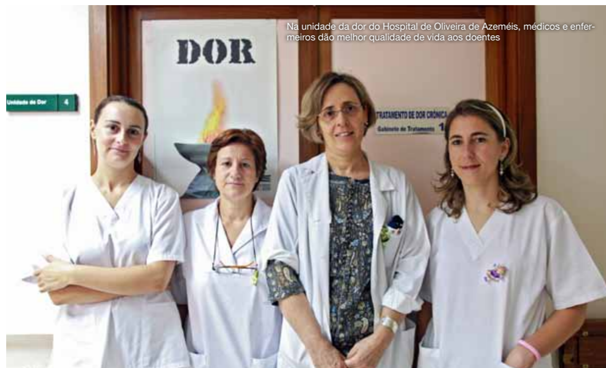
Na unidade da dor do Hospital de Oliveira de Azeméis, médicos e enfermeiros dão melhor qualidade de vida aos doentes

«Temos imensos doentes a fazer uma vida perfeitamente normal e ninguém sabe que é um doente oncológico com dor crónica.»